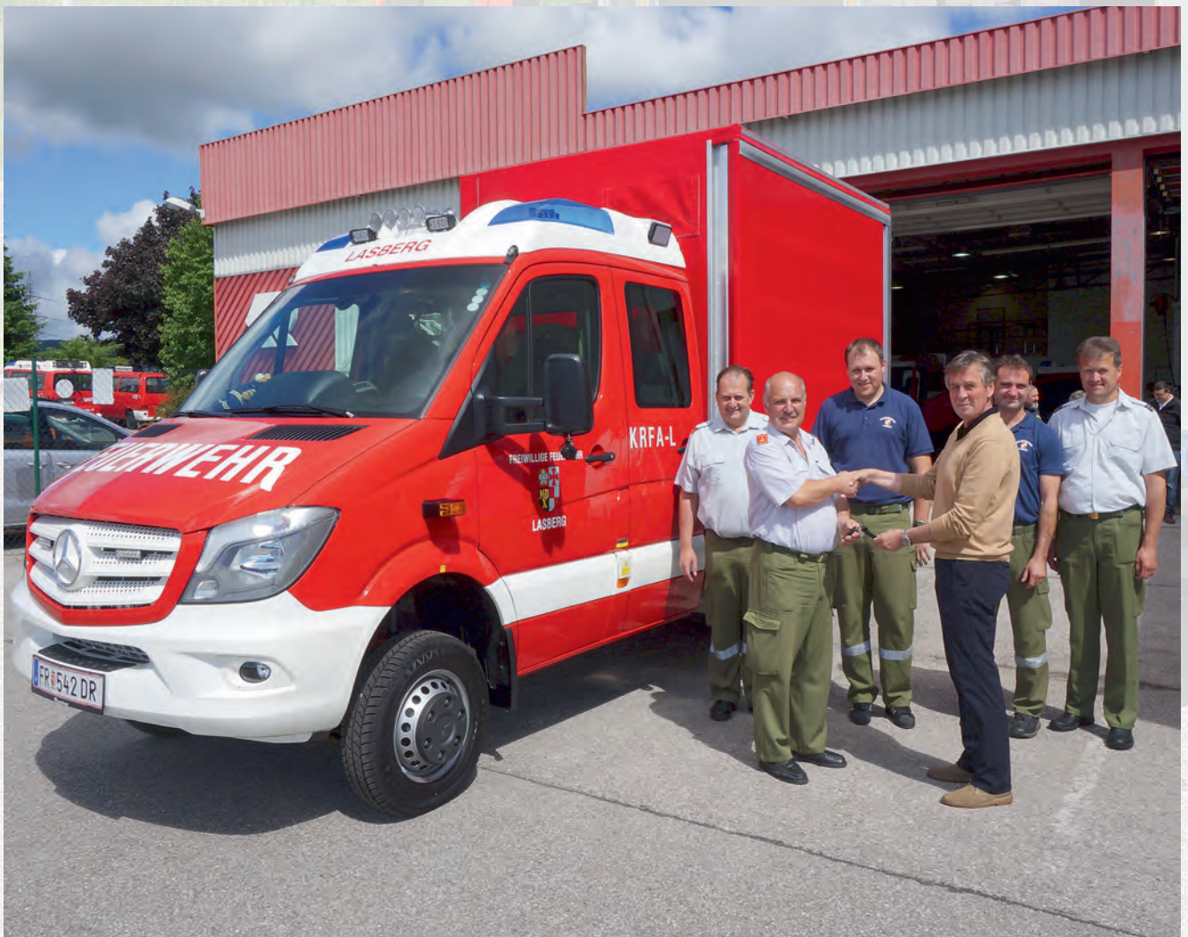
Eine Delegation unserer Feuerwehr bei der Abholung am 02.06.2016 in Neidling/NÖ.

Kurz gesagt ein Fahrzeug, welches für jede Art von Einsätzen verwendet werden kann. Da der Kraftfahrer auf ein Atemschutzgerät zurückgreifen kann, ist dieses Fahrzeug auch für Einsätze im Tunnelbereich geeignet.