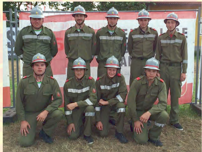
Bewerbsgruppe beim Landesbewerb in Frankenburg/OÖ.