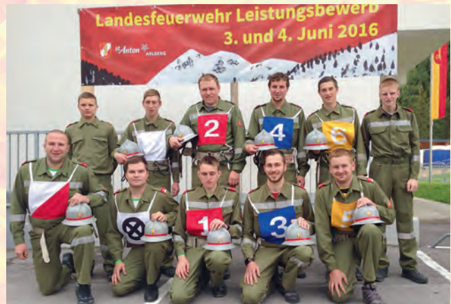
Bewerbsgruppe beim Landesbewerb in Tirol.