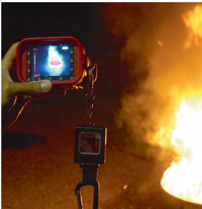
Ein interessanter Blick durch eine Wärmebildkamera.

Bei der Atemschutzübung im September wurde folgender Schwerpunkt beübt: Richtige Handhabung diverser Gerätschaften wie z. B. der Wärmebildkamera und die Atemschutz-Überwachung „Checkbox“.