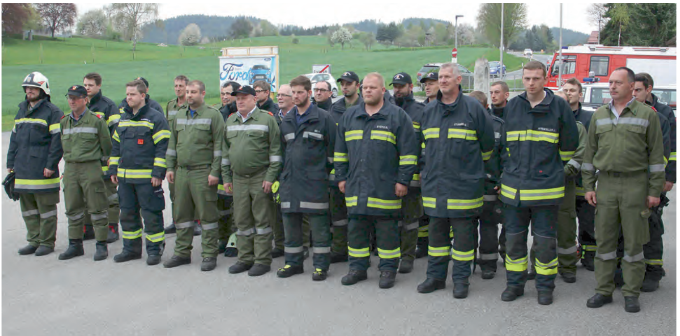
Unsere Kameraden – erste Reihe rechter Bereich – inmitten der Feuerwehrekameraden aus dem Bezirk Freistadt bei der Verkehrsreglerausbildung.