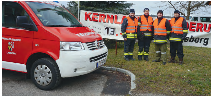
Unsere Lotsen beim alljährlichen IVV-Wandertag.

Bei 11 Lotsendiensten haben 46 Kameraden insgesamt mehr als 220 Stunden ihrer Freizeit geopfert.