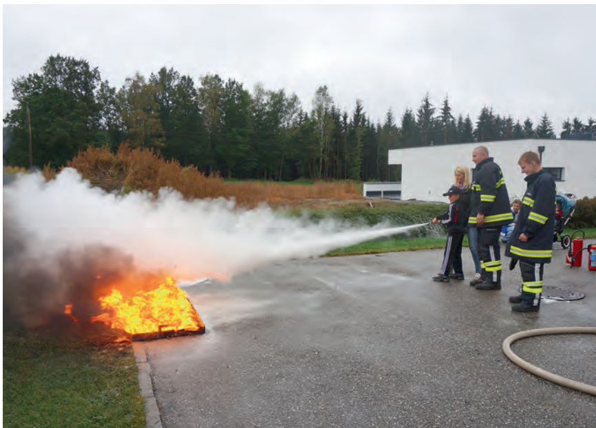
Auch die Handhabung eines Feuerlöschers muss geübt werden.