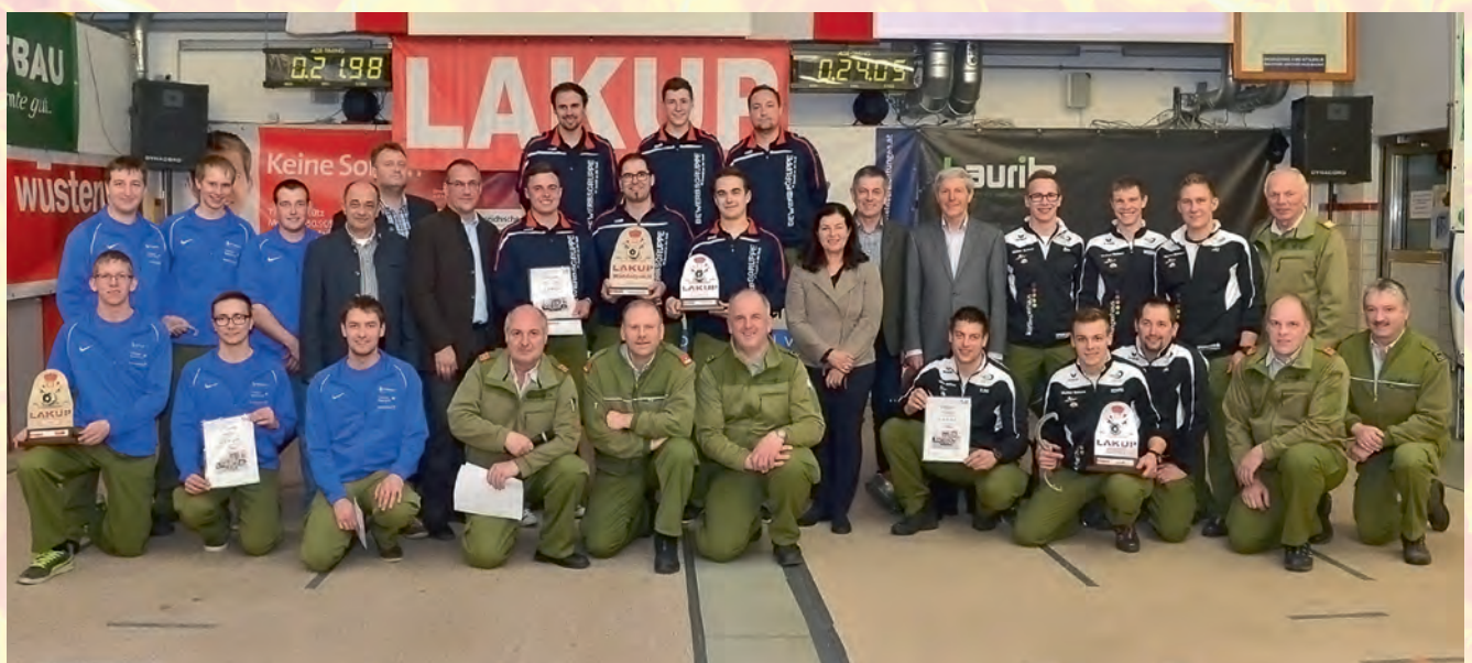
Siegerfoto LAKUP 2016.