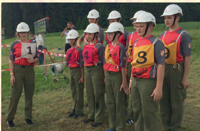
Jugendgruppe Lasberg am Start vor einem Bewerb.