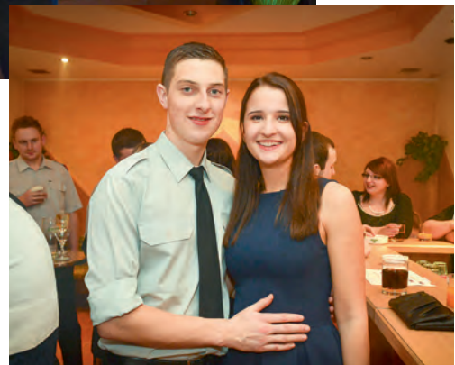
Impressionen aus unserer Schnapsbar.