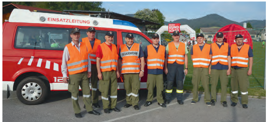
Unsere größte Herausforderung – der Lasberger Brückenlauf.